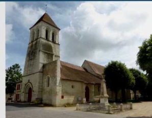
Bourg de Vendeuve, place de l'église en 2016.