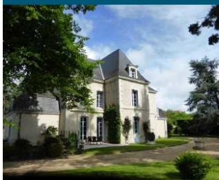
La maison de Vendeuve en 2016.

« Je suis arrivé à Vendeuve, c'est le temps des feuilles de papier qu'on remplit comme des paniers de pommes, des arbres qu'on taille, des livres qu'on lit ligne par ligne avec la méticulosité des enfants... C'est la sagesse de chaque été. »