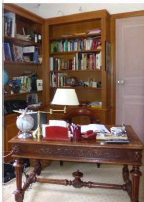
Le petit bureau de Michel Foucault, dans la maison de Vendeuve a été remeublé mais conservé.

Format : 21,5 x 21,5 cm Intérieur ; 64 pages, quadri Poids d'un exemplaire : 280 g ISBN : 978-2-951 876-13-2